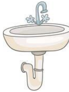
Sinki ya Bafu